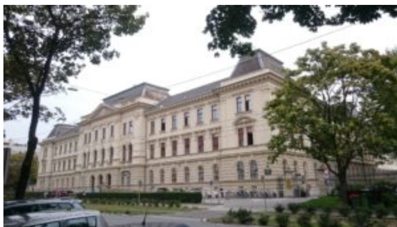
Landesgericht für Strafsachen Graz

Und einmal mehr danke ich auch der örtlichen BAR-Loge für den netten Empfang am Vorabend der grossen Prozesseröffnung! Leute, ihr seid Spitze.