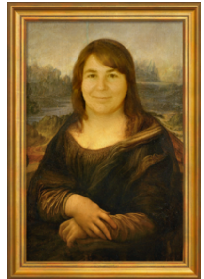
Satirische Fotomontage: "Moni Lisa"

sehr vieles davon aufgeschrieben, gebe hier aber bewusst nicht alles wieder. Ja, und überhaupt sollte ich noch anmerken: Ich habe den ganzen Prozesstag über so viel wie möglich so detailliert wie möglich aufgeschrieben, manchmal in wörtlichen Zitaten, bis mir die Finger schmerzten. Vielleicht werden meine Lügen, äh Berichte dadurch etwas länglich, aber dafür kann jeder, der möchte, den ganzen Prozesstag recht authentisch nachvollziehen.