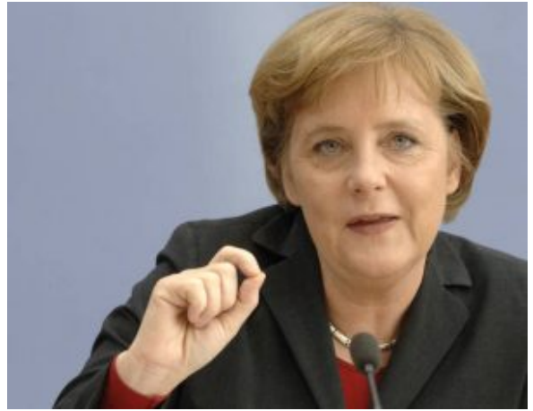
Merkel legt Obergrenze für Anschläge auf Flüchtlingsheime fest

Bundeskanzlerin Angela Merkel hat nach monatelangen Querelen und Streitigkeiten mit CSU-Chef Horst Seehofer der Einführung einer Obergrenze für Brandanschläge auf Flüchtlingsheime zugestimmt. „Dies ist die Konsequenz der nichtabreißenden Welle dieser Anschläge“, sagte Merkel gestern im Bundeskanzleramt. In Abstimmung mit Parteikollegen schlug sie vor, die Grenze auf 5.000 Anschlägen pro Jahr festzulegen. Das Gesetz soll diesen Monat noch durch den Bundestag.