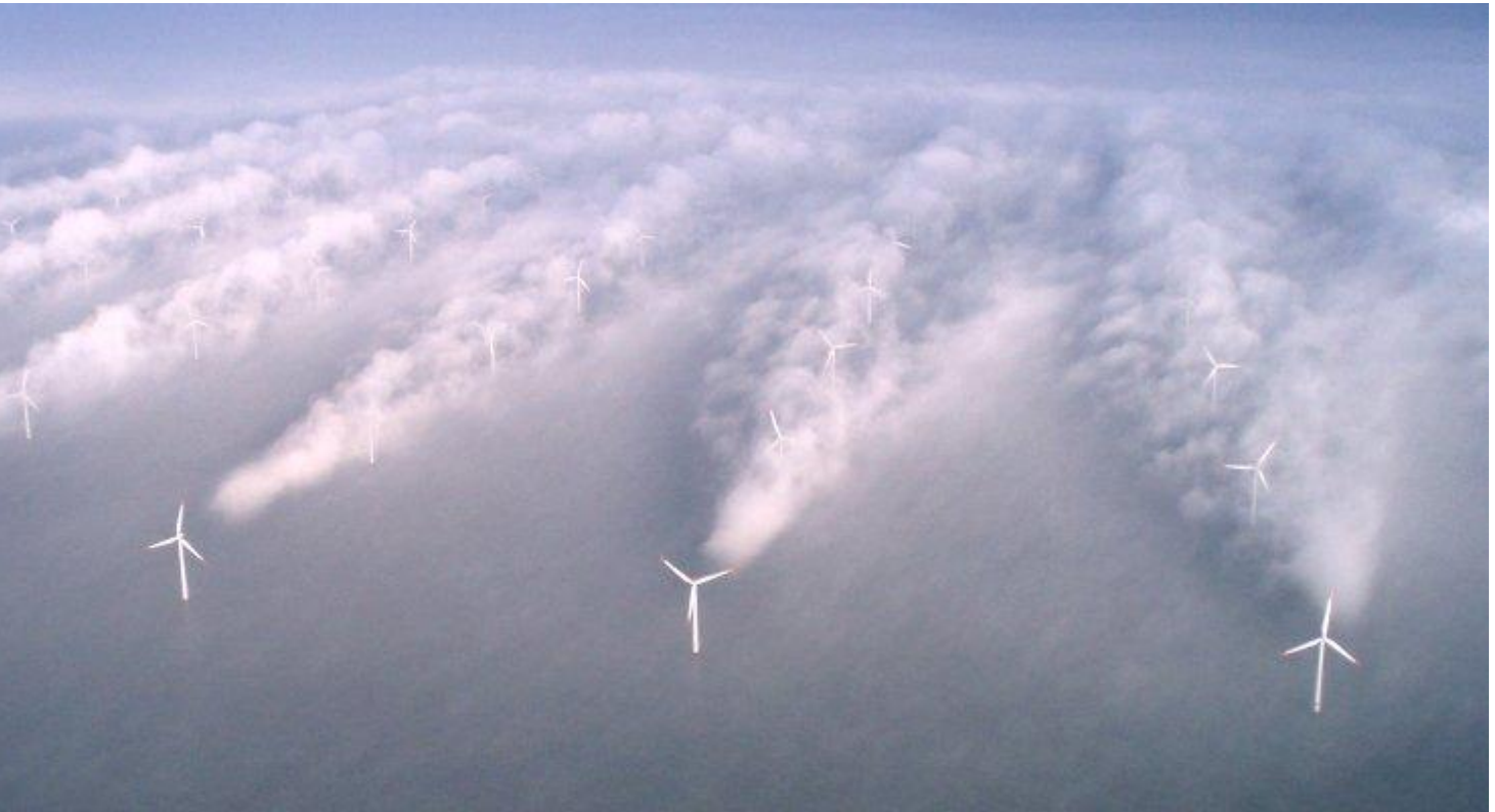
park im Testbetrieb

Neu Glienicke - Lange galten sie als Verlierer der Energie-Wende, doch jetzt entwickeln die großen Energieversorger in ihren Windparks ein neues, zukunftssträchtiges Geschäftsfeld: Geo-Engineering mittels Windkraftanlagen.