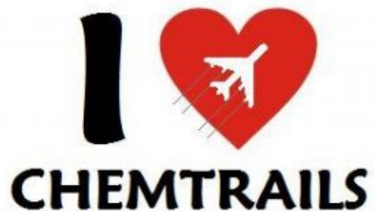
Logo des Think-Tanks "I Love Chemtrails"