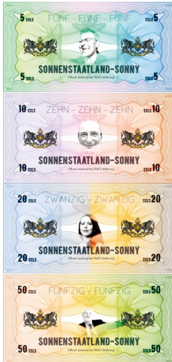
Sonnenstaatland-Währung - ein früher Entwurf

Da Sonnenstaatland ein Staat mit einer lupenreinen Diktatur, mit vollständiger Anarchie und etablierter Demokratie ist, wollen wir euch am Prozess der Gestaltung eures neuen Geldmittels teilhaben lassen. Durch unsere Aufforderungen mit international gültiger 21-tägiger Frist wurde eine Debelatio und Postliminium geschaffen durch die nun wir an der Reihe sind die Systeme der bestehenden kommissarischen Reichsregierung und anderen skurilen Organisationen aufzubrechen. An dieser Stelle zitieren wir einen alten, langjährigen, lieben und ausgeglichenen Freund: