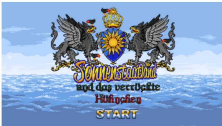
Sonnenstaatland und das verrückte Hühnchen - Trailer 1

Computerspiele machen Spaß. Doch was macht doppelt Spaß? Ein kleines Jump'n'Run im Sonnenstaatlanduniversum! Ihr wolltet schon immer mal auf Fitzek rumhüpfen? Jetzt könnt ihr es!