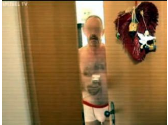
DPHW-General in Paradeuniform