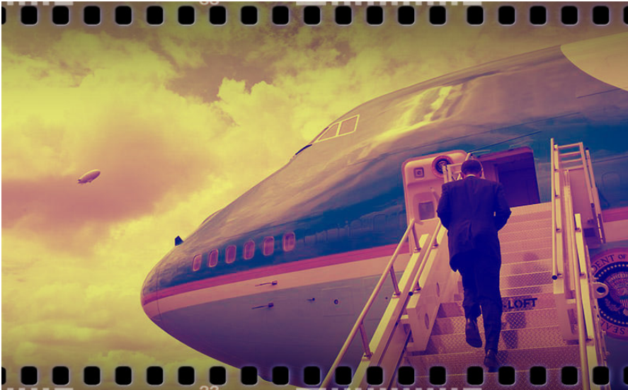
Der US-Präsident besteigt die Airforce 1