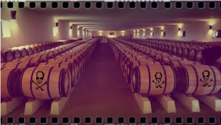
Fässer voller Chemikalien