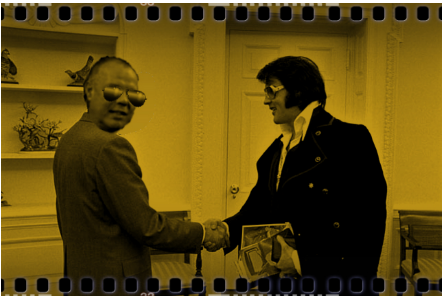
Empfang durch den King